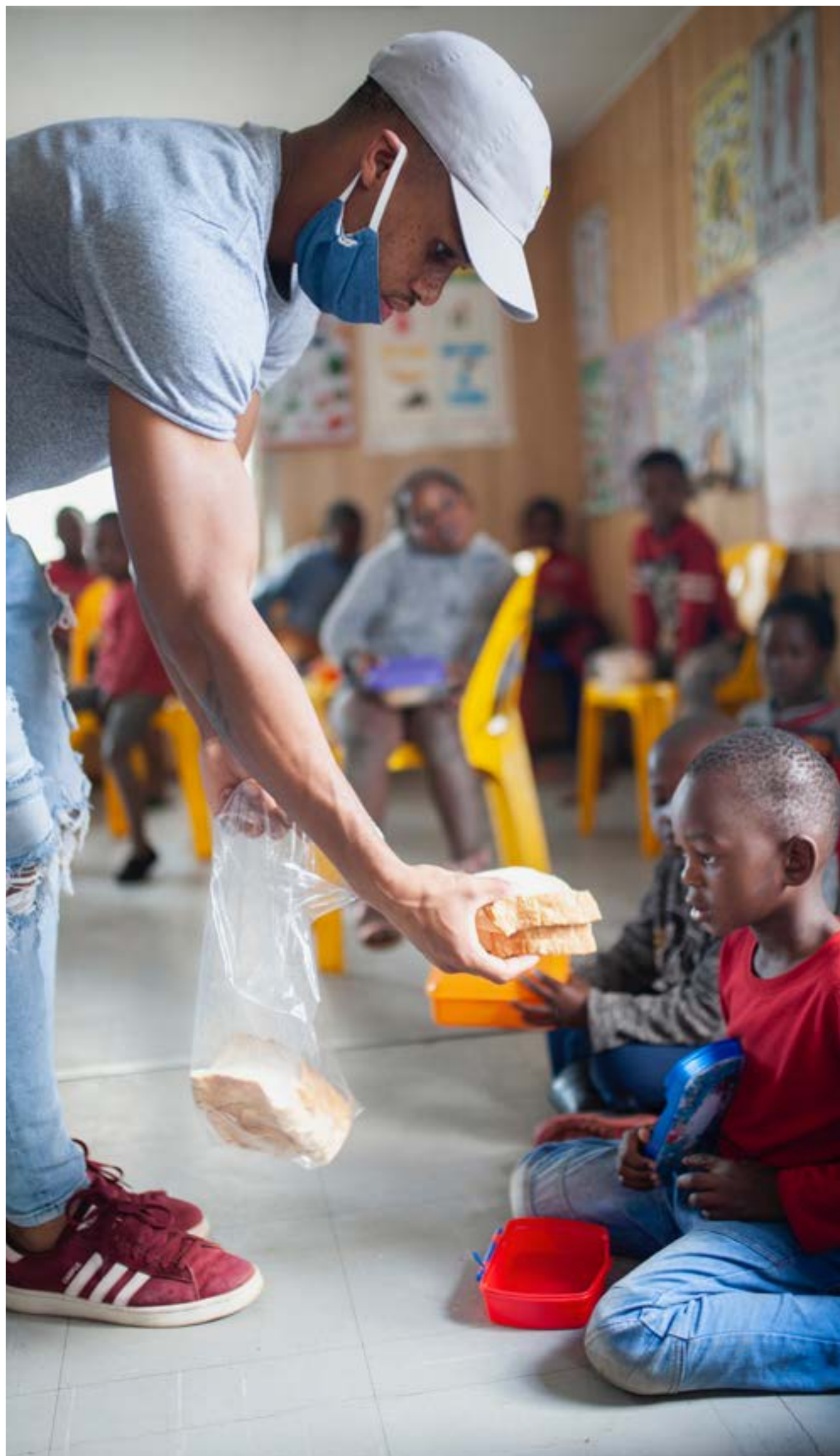
Een van Tebza se lewensdoelwitte is om die kinders van Hillbrow te inspireer en te bemagtig soos MES hom as tiener ondersteun het.