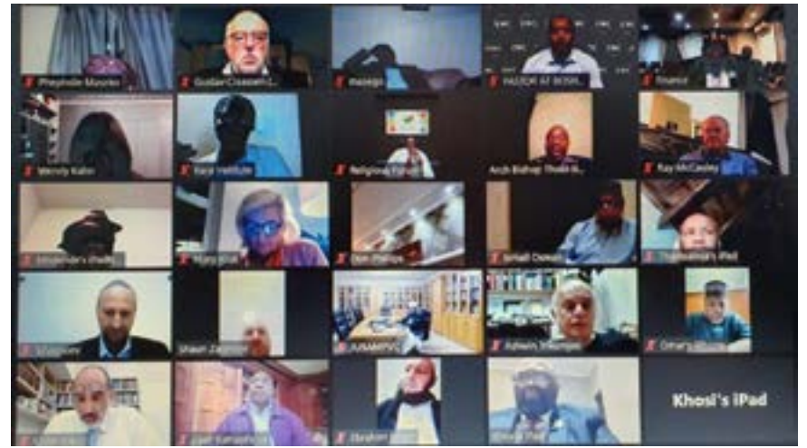
Met Vlak 3-regulasies "op die horison", sê sommige kerkleiers onder meer dat godsdienstige byeenkomste met beperkte getalle in "veiliger areas" van die land toegelaat behoort te word indien die nodige voorkomingsmaatreëls in plek is.

4. Skoonmaakmiddels moet beskikbaar wees vir alle geboue voor en na dienste om fasiliteite deeglik te steriliseer vir 'n volgende byeenkoms. Vloere en banke en stoele moet voor en na byeenkomste afgevee word.