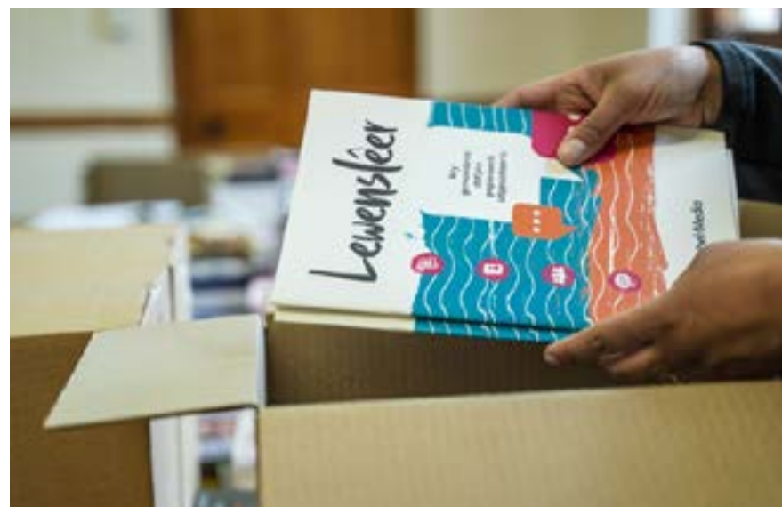
Personeel van Bybel-Media is hard besig om die bokse te verpak.

● Kerkbode is ’n Bybel-Media-publitasie.