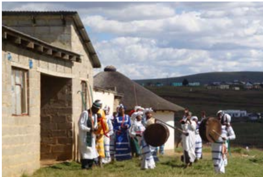
GODSDIENSPRAKTYK: "Die meeste van my eie bestudering het ek nie by 'welaf' Hollanders op 'n stadsplein gedoen nie, maar op voetsoolvlak in Suid-Afrika," vertel die skrywer in dié stuk. "En dit was by lidmate van kerke in plekke soos Langa in die Wes-Kaap, Phepheni in die Oos-Kaap en Atteridgeville in Gauteng".