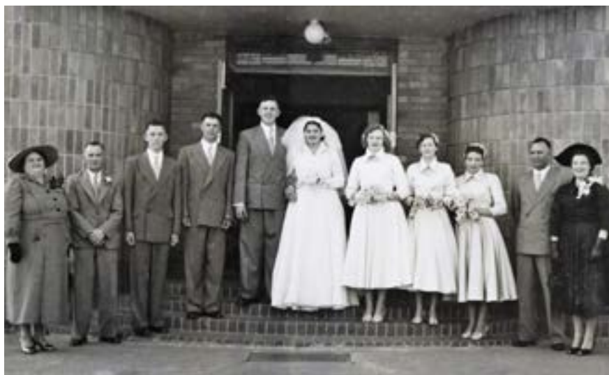
Voor die onthaal kon begin, is die foto's eers geneem, onthou die skrywer van troues van weleer. "In 'n ry sou hulle daar voor die ou Moederkerk gestaan het, die bruidegom, die bruid stralend, die onderskeie ma's met hulle hoë hare, en die pa's elkeen met 'n angelier in die lapel. Stemmig. Eenvoudig."

En wanneer die bruid die kerk ingestap het, met haar gevolg van blom- en strooimeisies, het almal regop gekom terwyl die orrelis Mendelssohn se troumars speel: "Pa-ra-pa-paaa, pa-ra-pa-paa ..." terwyl hier en daar 'n vrou 'n traan met 'n bewerige snesie afvee en die bruid se ouma effens te hard fluister: "Die kind lyk darem pragtig, nè?" Op ouma se kop 'n hoedjie