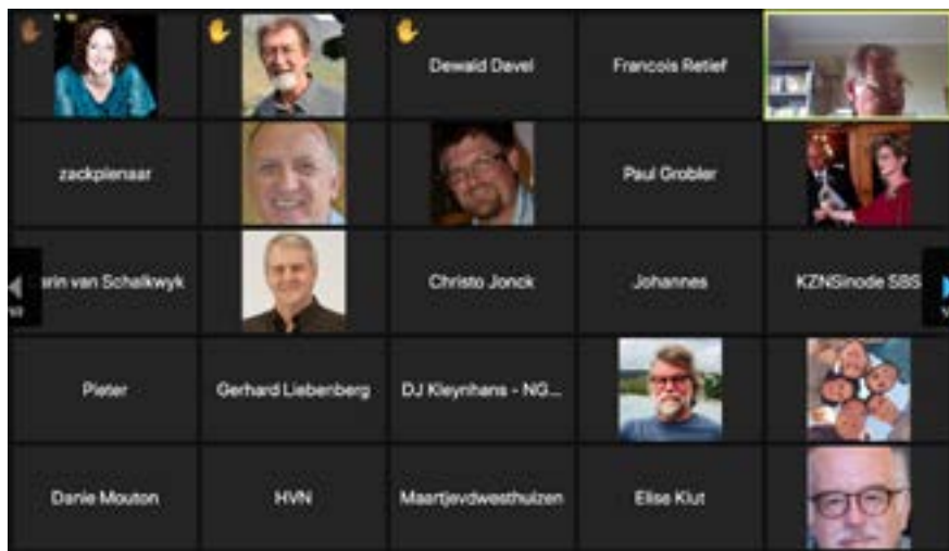
’n Skermgreep van die spesiale vergadering van die ASM.