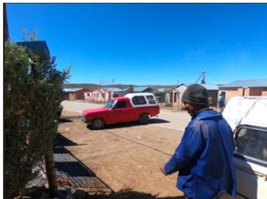
Mankopaa se vriend Gert Jafta het ook ’n 1400-bakkie, ’n rooie (sien foto), met ’n storie wat die skrywer nie wou glo totdat Gurries dit self vir my vertel het nie.