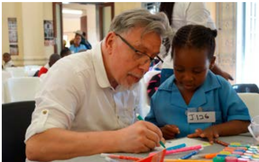
'n MES-vrywilliger help 'n naskoolse leerder met inkleurwerk.

Digitale vaardighede is vandag feitlik onmisbaar. MES beplan dus 'n inisiatief genaamd IT Pathway om kinders rekenaarvaardighede te leer. Verdere toekomsplanne sluit onder meer in die vind van kreatiewe oplossings vir werkloosheid en die behuisingstekort; uit te brei op hulle geakkrediteerde vaardighedsprogramme en om die agterstand in ontwikkeling by voorskoolse kinders te verminder; innoverende oplossings te vind vir families om bymekaar te bly, om maar 'n paar te noem.