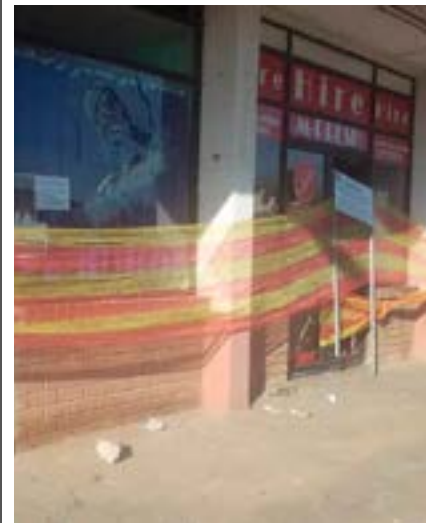
Die kantore van die Eswatini Conference of Churches – ’n ekumeniese liggaam waarby die Swaziland Reformed Church ook ingeskakel is – is ook aangeval, omdat die kerk daarvan beskuldig word dat hulle die koning ondersteun.

“In die lig van die nood in Eswatini wil ek graag ’n oproep aan lesers van Kerkbode rig om in hierdie tye te dink aan ons broers en susters in Christus wat in moeilike omstandighede in Eswatini moet oorleef.”