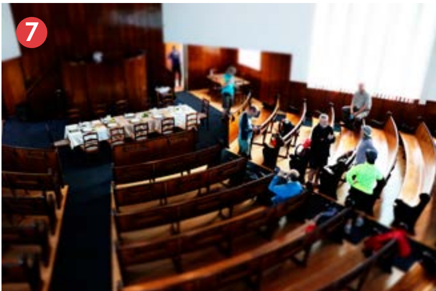
By NG Kerk Outeniqualand naby George het leraar en span sommer ’n ete vlak voor die kansel vir die pelgrims berei.