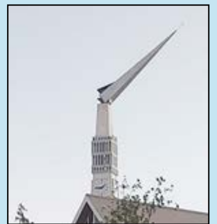
NG Kerk Willowmore se kerktoering is op 29 Junie 2021 beskadig deur ’n stormsterk wind.

• Lees meer hieroor by www.kerkbode.co.za .