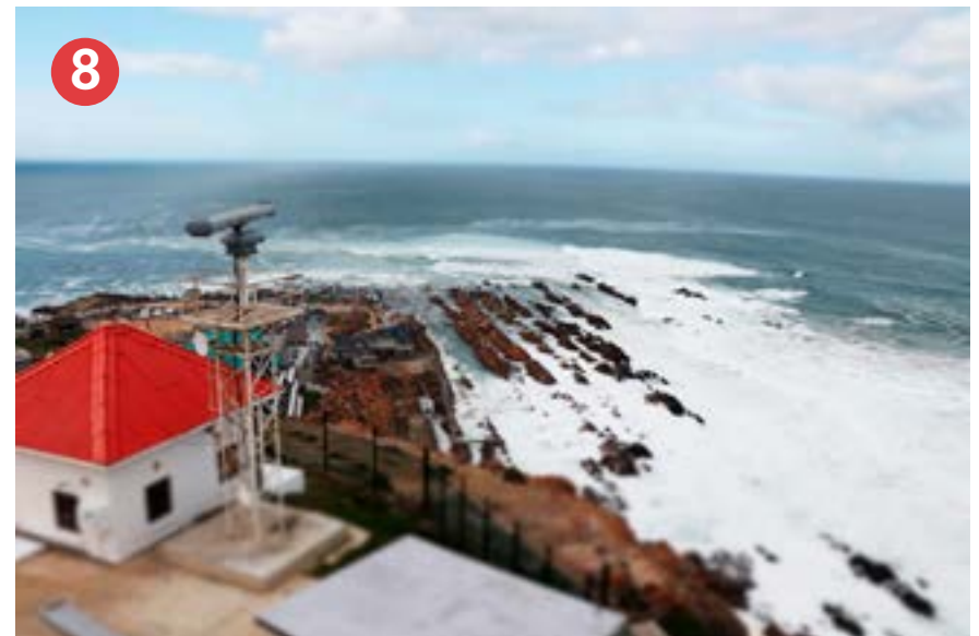
Die eindpunt? Hoewel die roete tans by St Blaize-vuurtoring by Mosselbaai eindig, is daar sprake van verder stap ... rigting Suidpunt van Afrika.