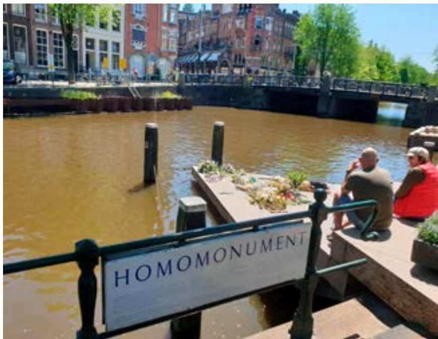
“Tydens my besoek aan die Anne Frank-huis – ’n klipgoot van die Homomonument – vertel die toergids dat gay mense ongeag hulle herkoms, geloof, ras of kultuur net soos die Jode eers van alle regte en menswaardigheid gestroop, en later vervolgd is,” skryf Mias van Jaarsveld in die rubriek hierbo. “Gay mense is as subspecies beskou – ’n bedreiging vir die suiwer, Ariese ras.”

“Dit is tagtig jaar later, en gaywees is nog steeds ’n doodsvonnis vir baie mense! In sommige lande word jy doodgemaak as jy gay is.”