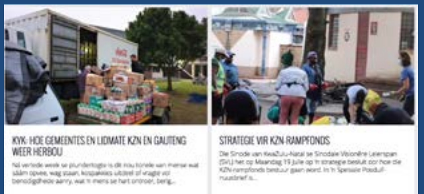
KVK: HOE GEMEENTES EN LIDMATE KZN EN GAUTENG WEER HERBOU

Kerkbode se beriggewing oor die 'herophou' van KZN en Gauteng het groot belangstelling gelok by www.kerkbode.co.za . Kliek op NUUS op ons webwerf as jy meer wil weet of betrokke wil raak.