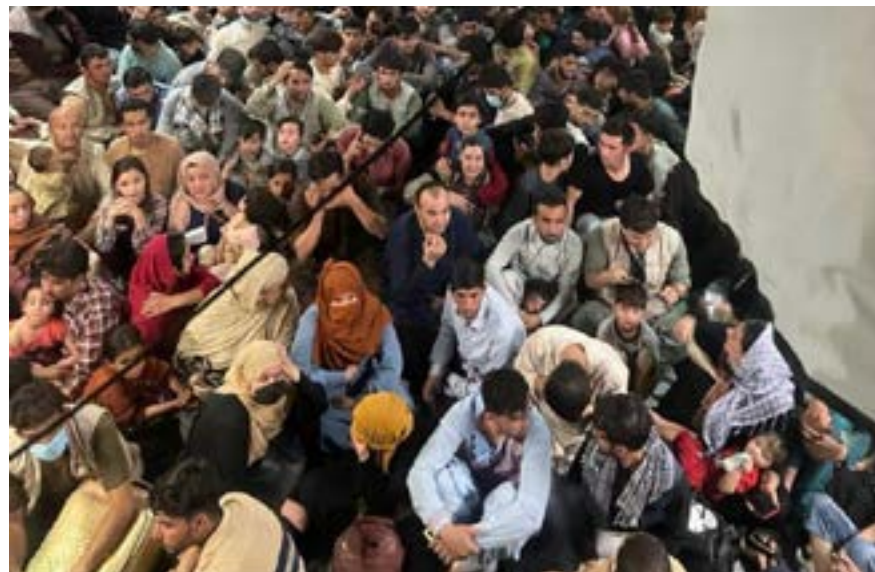
Die sowat 640 Afgaanse vlugtelinge wat Sondag 15 Augustus op Kaboel in ’n US C-17 Amerikaanse militêre vragvliegtuig saamgebondel het om uit die land te vlug.

Afganistan is tweede op Geopende Deure se gebedslys van lande waar gelowiges vervolgt word.