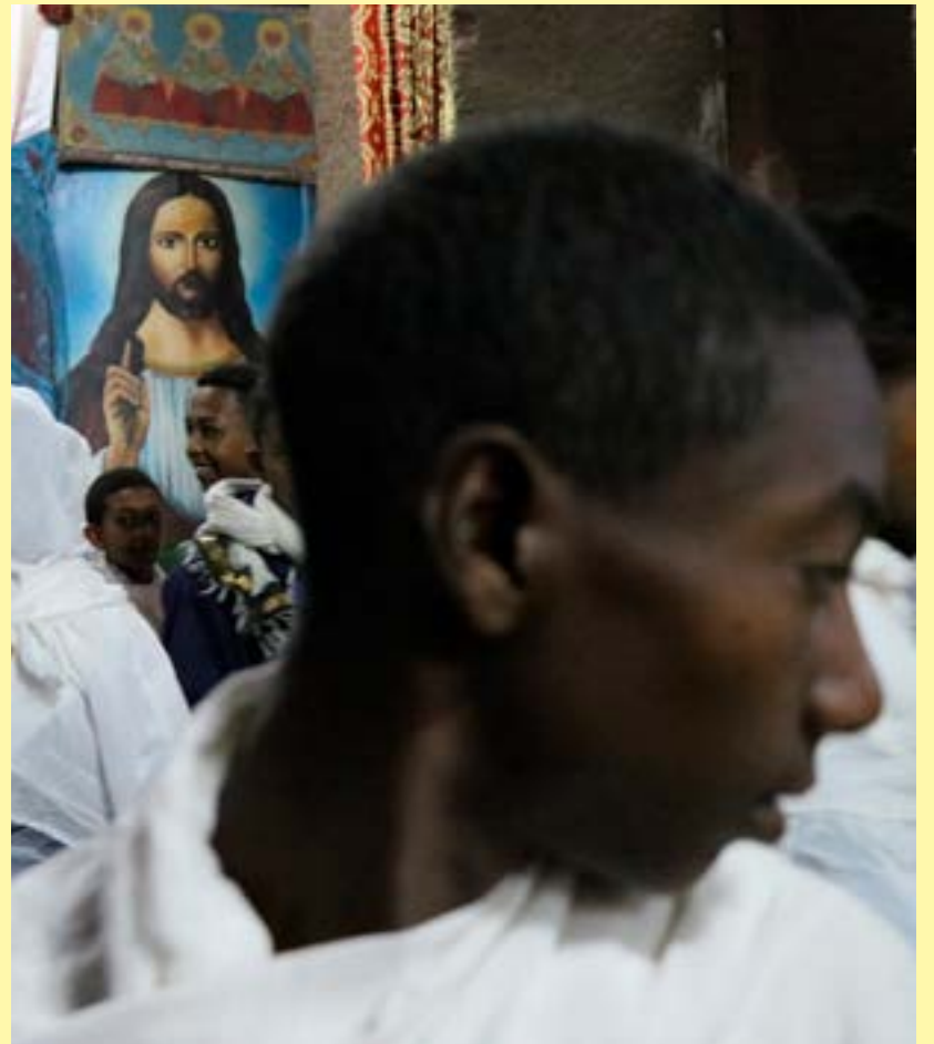
Een van die aanbiddingsplekke by Lalibela.

Etiopië is die oudste onafhanklike land in Afrika, met 'n bevolking waarvan 43% uit die sowat 108 miljoen inwoners Etiopies-Ortodokse Christene is.