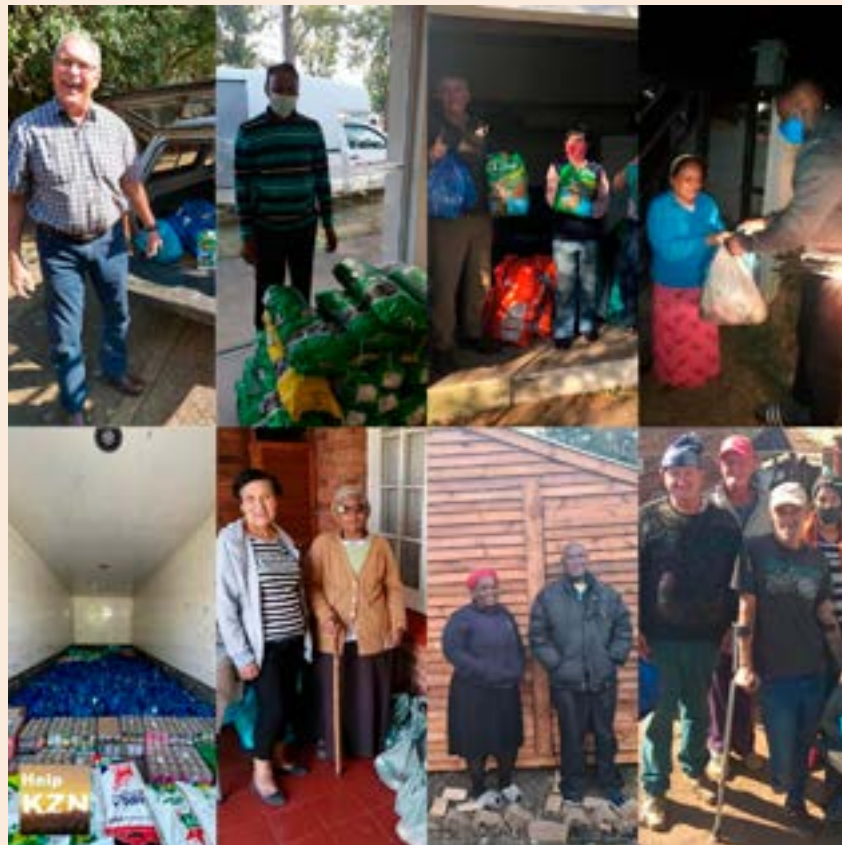
BO: Die blydschap op die gesigte vertel hulle eie storie van blydschap oor die verligting wat deur die NG Kerk in KZN se Help KZN-hulpfonds moontlik gemaak word.

Dit is egter die ervaring van hoe mense oor grense heen na mekaar uitreik wat hoop gee vir baie plaaslike gelowiges. “Waarop die lig moet skyn