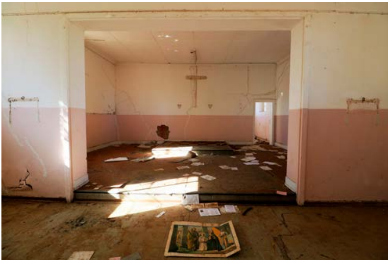
Vader Claerhout se kerkie.

Ek stap buitetoe. In die verte, na Clocolan se kant toe, is die sonneblomlande nog geel in die blom.