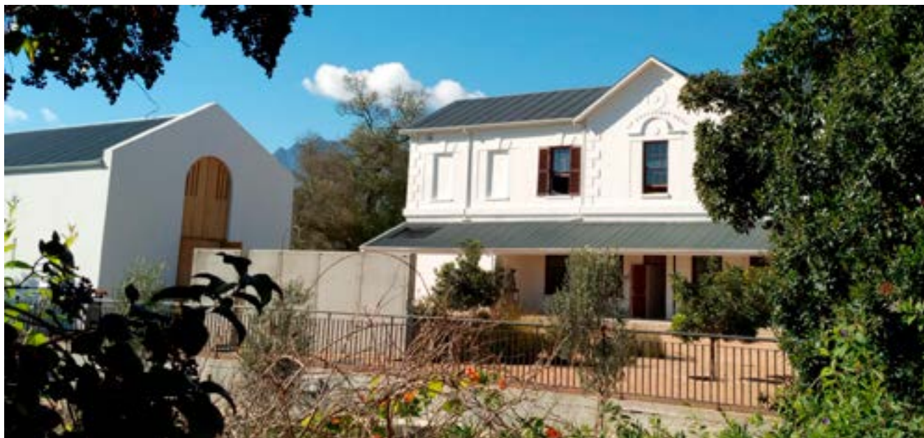
Huis Samuel is nou 'n blyplek vir mense wat na die Andrew Murray Sentrum vir Spiritualiteit kom.

Van hierdie nuwe kerklike "omgewing" getuig die mooi terrein van die Andrew Murray Sentrum vir Spiritua-