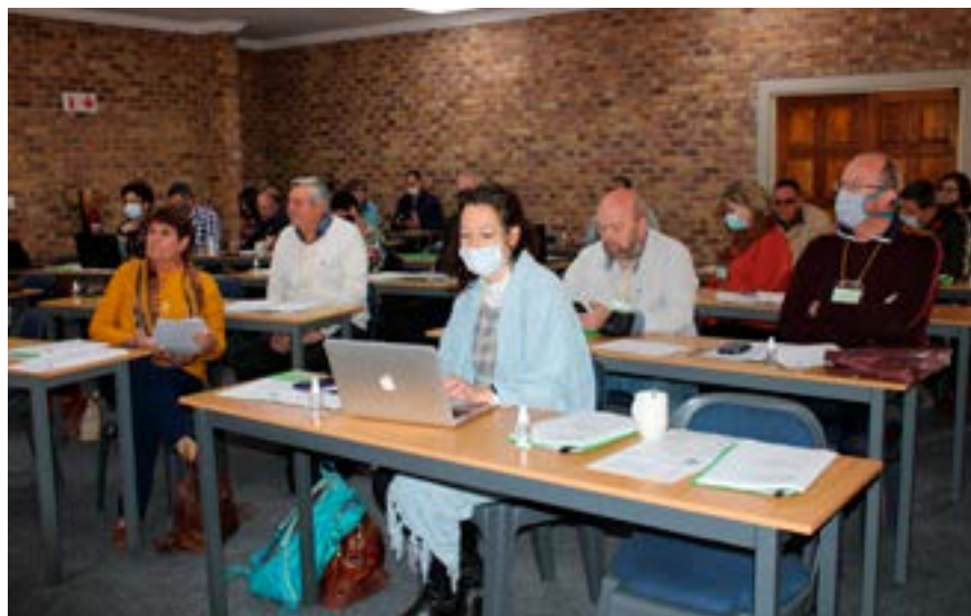
Die NG Kerk het 'n ryke skat in kundigheid in haar maatskaplike werkdienstorganisasies en dit is tyd dat kerke dit benut om 'n ligpunt in hulle gemeenskap te wees, is gesê by 'n onlangse werkwinkel wat die Kerklike Maatskaplike Diensteraad by die Emseni-konferensiesentrum in Benoni gehou het.

Die tema van die werkwinkel was lig. Een ligpunt volgens Van der Merwe is die paradigmaskuif in die NG Kerk oor die laaste paar dekades na missionale kerkwees wat die basis voorsien vir 'n nuwe besinning oor die roeping van 'n gemeente. Dit toon ooreenstemming met kerklike gesprekke wat tans in Europa gevoer word oor diakonia en 'n behoefte plaaslik aan 'n nuwe besinning oor die teologie van diakonaat.