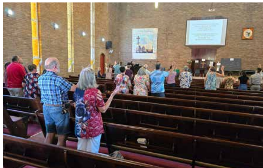
Die gemeente het gesien dat hulle lidmaatgetalle drasties minder word.