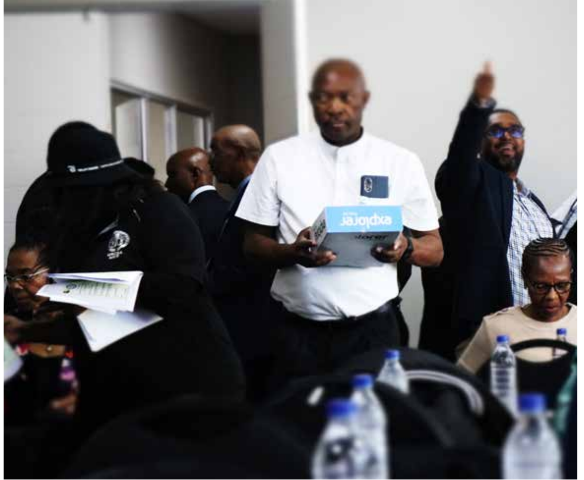
Die Vergenigende Gereformeerde Kerk (VGK) se plek in 'n "brose" wêreld en die impak van konflik in wêrelddele soos Rusland en Oekraïne asook Israel en Gasa ... Dit is van die temas wat by 'n konferensie vir ekumeniese VGK-vennote bespreek is.