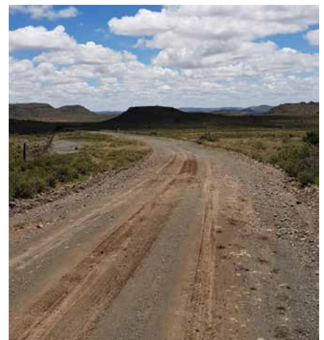
So lyk 'n tipiese plaaspad vir huisbesoek ...