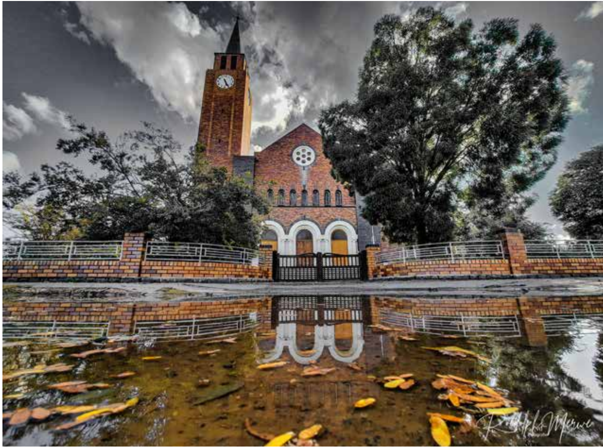
Kerkgebou van die NG Gemeente De Aar.