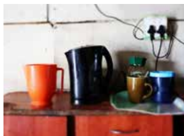
Cindy se elektrisiteit hou meestal net die eerste paar weke van 'n maand. Daarna verkoop sy hoenderpote vir ekstra geld.